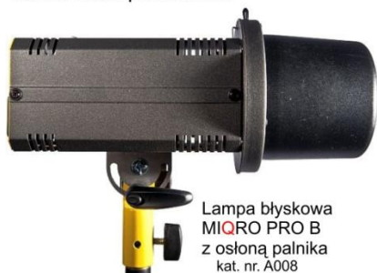
Lampa błyskowa MIQRO PRO B z osłoną palnika kat. nr. A008