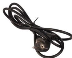
Przewód zasilający kat. nr. A100