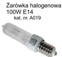
Żarówka halogenowa 100W E14 kat. nr. A019